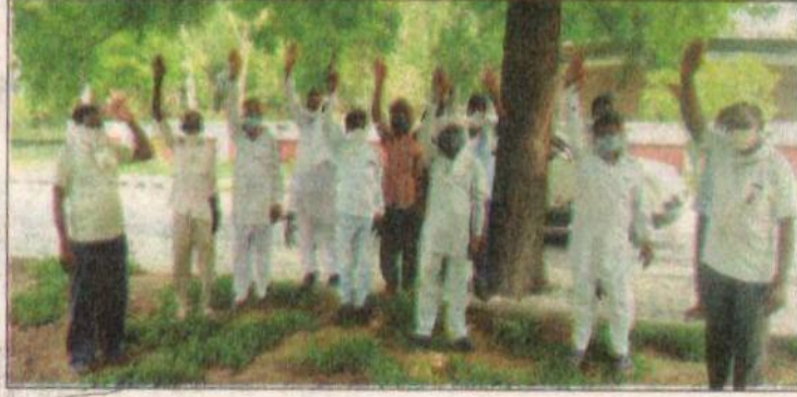
रोष प्रदर्शन करते हुए सफाई कर्मचारी।

हिसार, 16 जुलाई (ब्यूरो): चौधरी चरण सिंह हरियाणा कृषि विश्वविद्यालय के सफाई कर्मचारी यूनियन के कई सदस्यों ने एकजुट होकर यूनियन के चुनाव करवाए जाने की मांग उठाई है। बीते 16 मई को यूनियन के