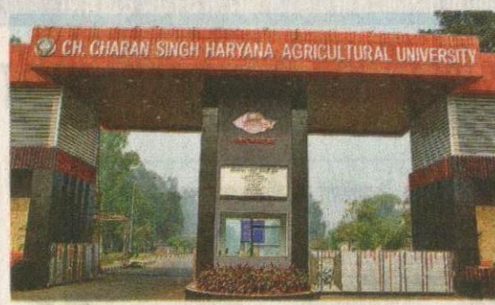
चौधरी चरण सिंह हरियाणा कृषि विश्वविद्यालय। •

इसके साथ ही रबी व खरीफ मौसम में फसल चक्र को अपनाया चाहिए, जिससे भूमि की उपजाऊ शक्ति बनी रहती है। रामधन सिंह सीड फार्म के दौर के दौरान उन्होंने कृषि वैज्ञानियों को किसान हितैषी