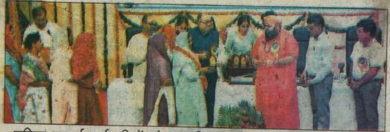
महिला सफाई कर्मचारियों को सम्मानित करते कुलपति एवं अन्य

भगवान वाल्मीकि के जीवन का प्रत्येक पहलू हमें आदर्श जीवन जीने की शिक्षा देता है तथा पूरे समाज को एक शक्तिशाली समाज में परिवर्तित कर अपनी संस्कृति की रक्षा