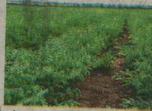
चने की फसल का फाइल फोटो।

चौधरी चरण सिंह हरियाणा कृषि विवि के कुलपति प्रो. बी.आर. काम्बोज ने बताया कि हरियाणा क्षेत्र के लिए हरियाणा चना नंबर 1 एचसी 1, हरियाणा चना नंबर 5 (एच सी 5), हरियाणा चना नंबर 6 (एच सी 6) और हरियाणा काबुली चना नंबर 2 (एच के 2) इन देसी व काबुली चने की उन्नत किस्में हैं। इन उन्नत किस्मों की बिजाई का समय 30 अक्टूबर से 15 नवंबर तक है और बीज की मात्रा 16 किलोग्राम प्रति एकड़ है। हकृवि वैज्ञानिक डॉ. सुनील कुमार ने बताया कि अगेती बिजाई कभी न करें। अनुसंधान निदेशक डॉ. राजबीर गर्ग ने बताया कि बिजाई 'पोरा' विधि से 2 खुड्डों का फासला 30 सेंमी. रखकर इस प्रकार करें कि बीज 10 सेंमी. गहरा पड़े। जहां खेत में आल की कमी हो तो 2 खुड्डों का फासला 45 सेंमी. रख कर बिजाई के समय 12 कि.ग्रा. यूरिया व 100