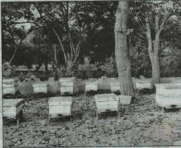
मधु मक्खी पालन के डिब्बे।